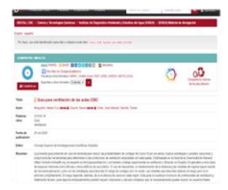
Guía para la ventilación de las aulas.