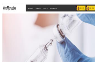
Podcast #conprueba: Las vacunas contra la COVID-19