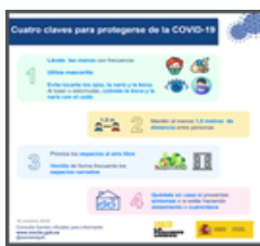
Cuatro claves para protegerse de la COVID-19