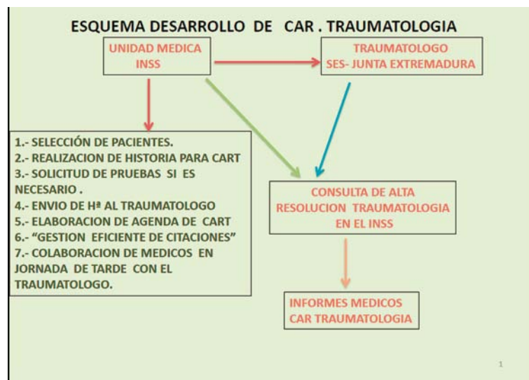
Figura 2. Muestra el esquema de funcionamiento de las consultas CART