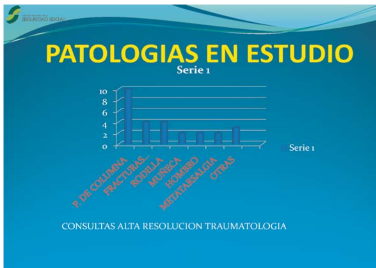
Tabla 1. Distribución de las patologías estudiadas

La distribución de articulaciones objeto de valoración fue la siguiente la que se expone en la Tabla 1 , siendo la gran mayoría patología de columna.