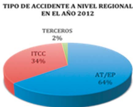
Figura 2. Porcentajes de Asistencia en la Regional Canarias Año 2012

Tras recopilar, el número total de procesos Lumbares por las UPS de la Regional Canarias durante el año 2012 y extrapolarlo al colectivo protegido de AT (figura 3), se observó que el 23% del colectivo protegido total de dicha regional, presentó un accidente de trabajo, de los cuales un 4% se correspondían con un proceso de lumbalgia, el cual a su vez, se corresponde con el segundo diagnóstico de mayor prevalencia en la Regional Canarias.