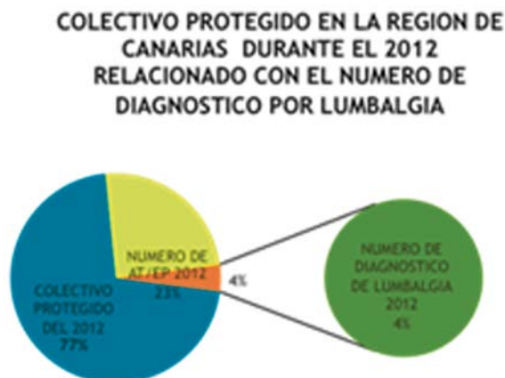
Figura 3. AT por Lumbalgias sobre Colectivo Protegido en la Regional Canaria Año 2012

También se valoraron las pruebas Biomecánicas solicitadas durante el 2012 en nuestros dos únicos proveedores (Proveedor I y II) en todas las UPS de la Regional Canarias, encontrando que se solicitaron un total de 103 pruebas, lo que supuso un total de gastos centralizados de 30.871,99€ (tabla 1 y figura 4), de las cuales sólo 10 pruebas fueron para estudio de patología lumbar.