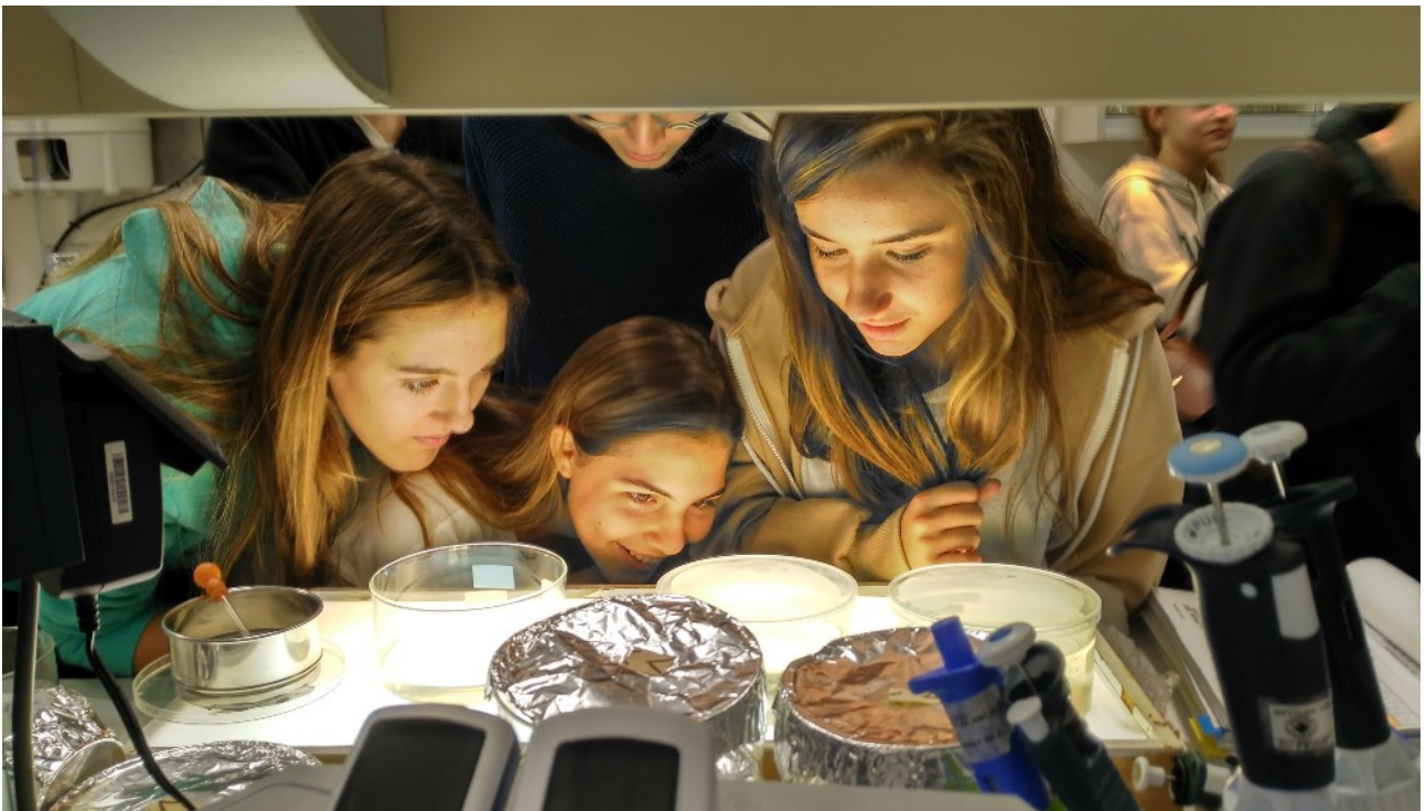
Alumnas de un Instituto de Madrid disfrutaban de una de las actividades planteadas por el ISCIII en la Semana de la Ciencia