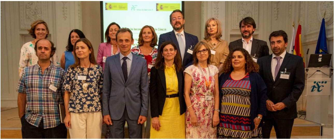
Foto de familia en la jornada celebrada en el ISCIII sobre la Misión Cáncer en Europa, presidida por el ministro de Ciencia, Pedro Duque.