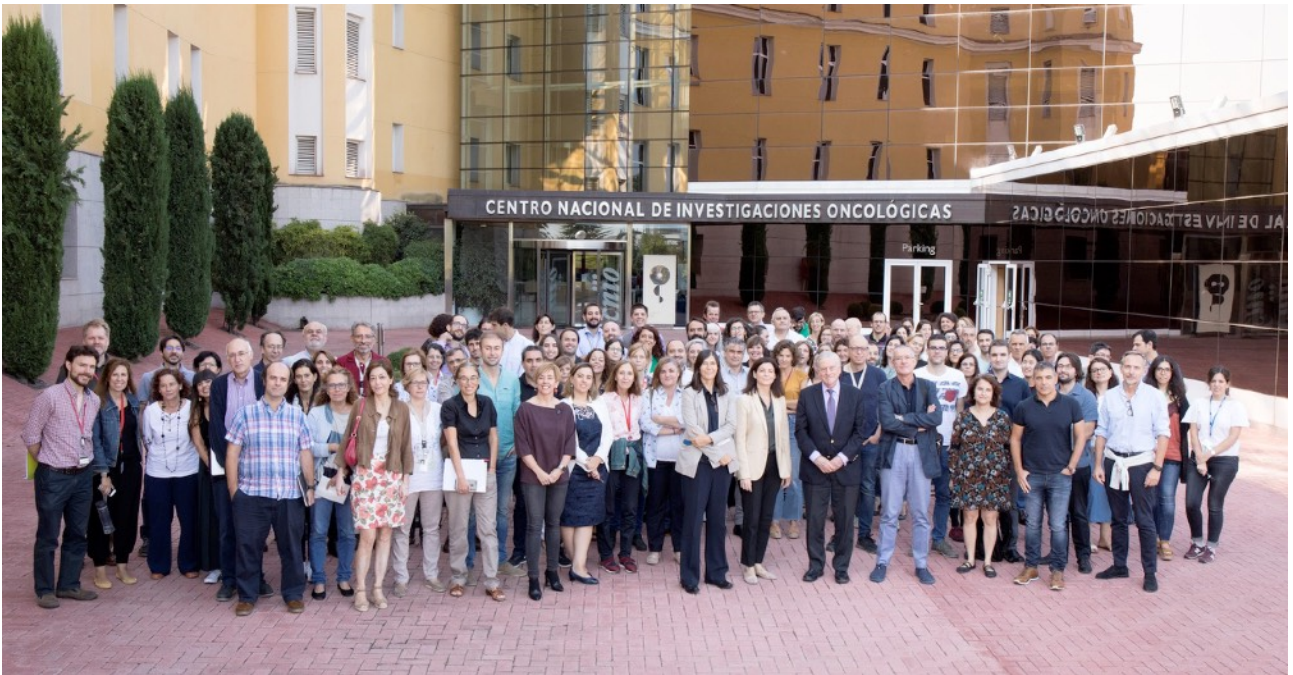
Foto de familia de la reunión conjunta de investigación CNIO-CNIC, celebrada el pasado mes de septiembre.