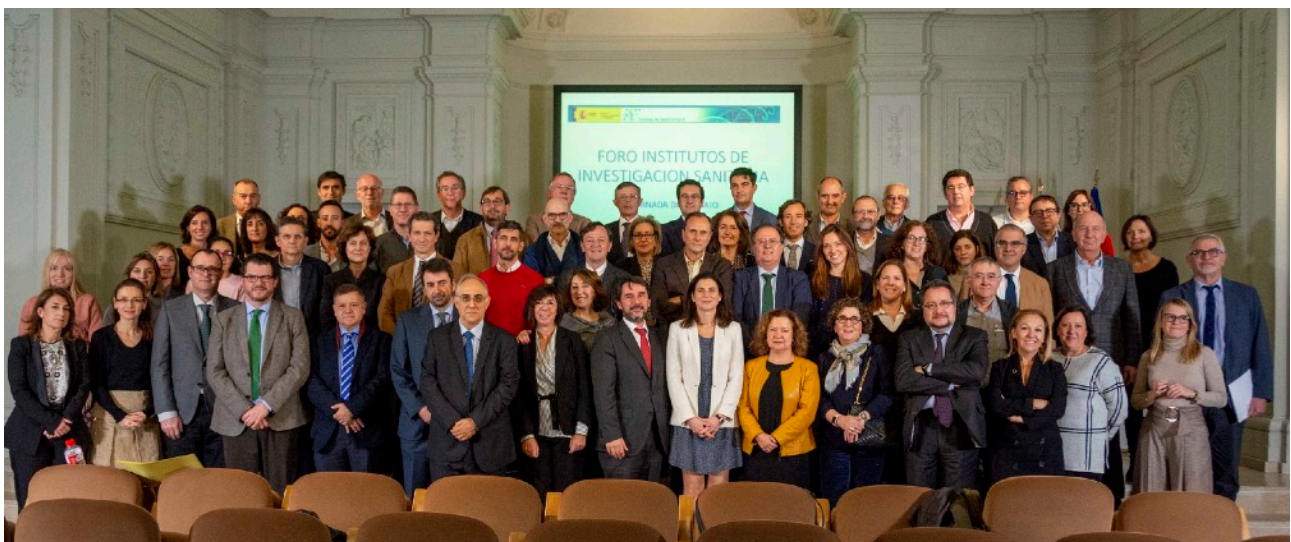
Reunión de creación del Foro de Institutos de Investigación Sanitaria.

Además, el ISCIII está muy atento al desarrollo de las futuras misiones europeas de investigación, con especial foco en la Misión Cáncer , tal y como quedó claro en una jornada informativa celebrada antes de verano, que contó con la presencia del ministro de Ciencia, Innovación y Universidades, Pedro Duque.