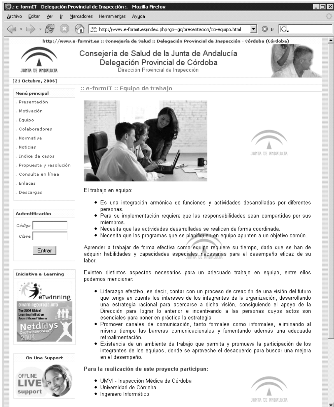
Figura 2. Equipo de Trabajo.