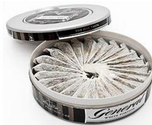
Snuss, Prohibido en toda la UE excepto en Suecia