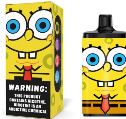
Vapers con diseños infantiles