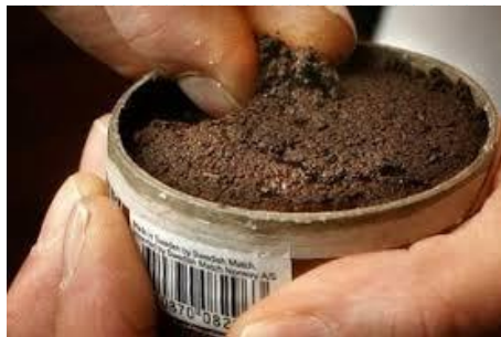
Tabaco de mascar /Tabaco de uso nasal