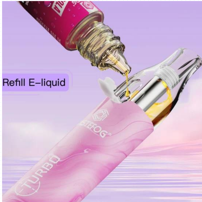
Vapers que incumplen la normativa sobre seguridad de DSLN