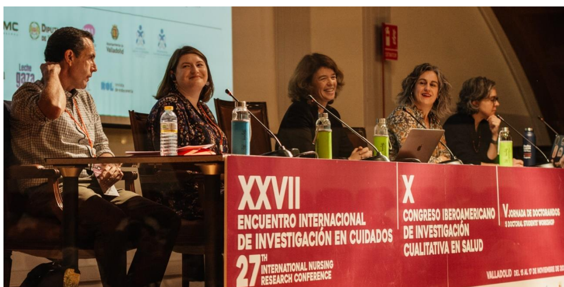
Imagen de una de las mesas redondas del encuentro, celebrado en Valladolid con presencia de más de 500 enfermeras y profesionales de la salud del ámbito nacional e internacional.

El Encuentro Internacional de Investigación en Cuidados, organizado por la Unidad de Investigación en Cuidados y Servicios de Salud ( Investén-isciii ) del Instituto de Salud Carlos III (ISCIII), celebrado en Valladolid, ha sumado este año la presencia de Iberoamérica gracias al Congreso Iberoamericano de Investigación Cualitativa en Salud (CIICS), la cita más relevante de la investigación cualitativa en salud de esta región. En la reunión han participado más de medio millar de enfermeras y otros profesionales de la salud del ámbito nacional e internacional.