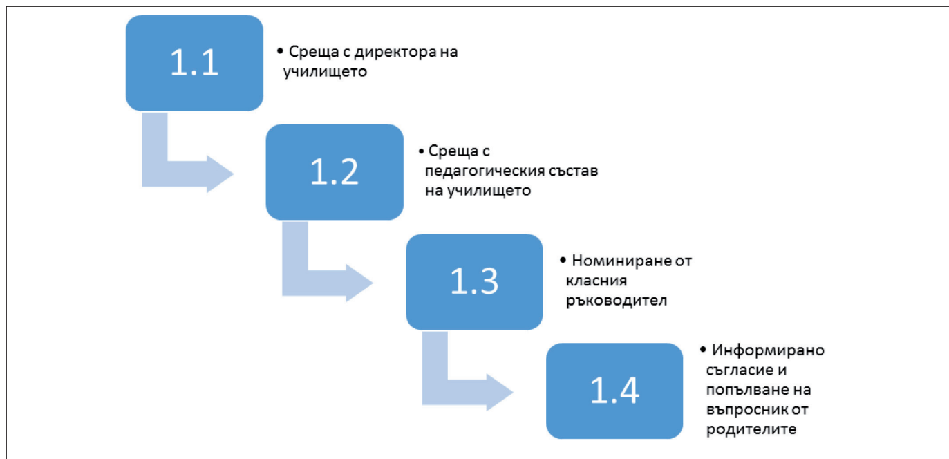
Диаграма 2. Основни стъпки при етапа на скринингово проучване и определяне на случаи

чава формуляр за номиниране на суспектни случаи от своя клас. Учителят може да предложи до четири деца, проявяващи определени черти на поведение и общуване. Той следва да номинира и равна по брой контролна група от деца, не проявяващи описаните във въпросника характеристики. Формата за номинация е анонимна и не съдържа лични данни за посочените деца. Във втората фаза на скрининга, класният ръководител предоставя формуляр за информирано съгласие на родителите на номинирани суспектни и контролни случаи, заедно с въпросник за PAC. Родителите или настойниците имат право да откажат да дадат информирано съгласие, с което се прекратява участието на тяхното дете в проучването.