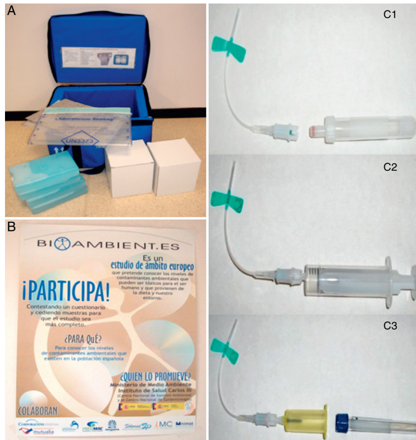
Figura 2. Estudio BIOAMBIENT.ES, 2009-2010. A) Embalaje isotérmico para el transporte de muestras. B) Póster del estudio. C1-C3) Dispositivo empleado en la extracción de muestras de sangre en función de la técnica empleada (diferentes tipos de tubos o jeringas).