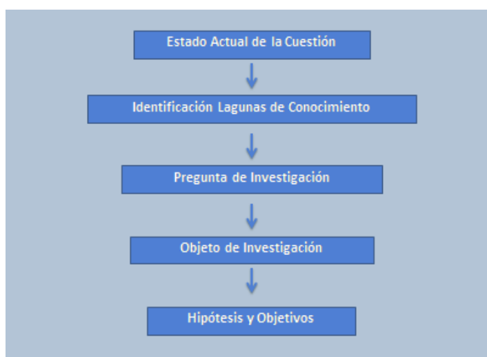
Figura 3. Secuencia argumental en el apartado de Introducción