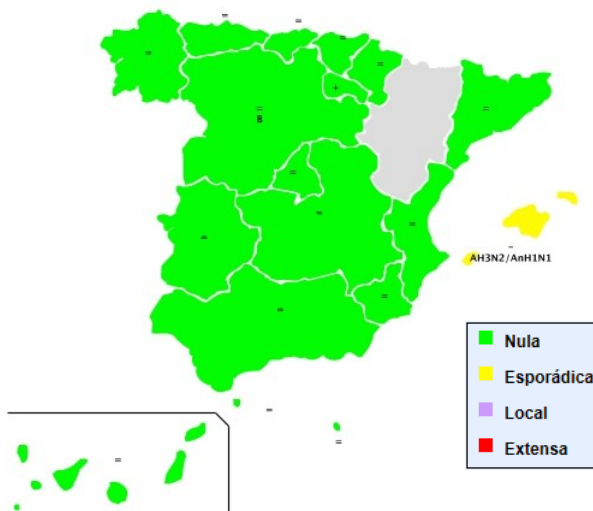
Figura 1. Nivel de difusión de la gripe. Semana 43/2019. Temporada 2019-20. España